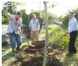
Plantation d'un arbre de la paix

Si Canaan a été un succès en 2007, c'est en partie grâce à la ville de Moisson et à la volonté et à l'aide de ses habitants.