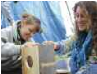
Constructions de nichoirs dans la bonne humeur

A partir de là, les conseillers de la mairie ont eu une idée. On venait de leur rétrocéder une ancienne carrière de sable qu'on avait remblayé. Ils venaient de reboiser l'endroit et voulaient faire revenir les oiseaux. Le service était lancé.