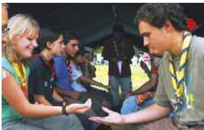
Jeu sur l'Europe

il existe autant de différences de pensées et de sentiments qu'il y a eu de langages et de races. La guerre nous a appris que si une nation cherche à imposer une volonté sur les autres, il