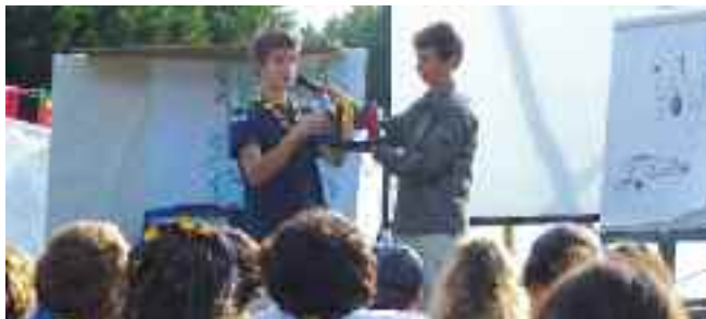
Démonstration de l'utilisation d'un préservatif

« A refaire, on a toujours l'impression de tout savoir, ce qui n'était pas le cas et ça a permis de parler de manière totalement décomplexée de tous les sujets ».