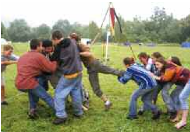
Jeu sur les différences homme/femme

Pour finir, voici une recette que nous devons tous de connaître [il ne