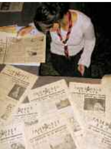
Lecture des journaux du jamboree

Moisson est un haut lieu du scoutisme, témoin du jamboree de la paix de 1947, seul jam jamais organisé en France. C'est ici que CANAAN a décidé de poser ses valises en 2007 pour fêter le centenaire du scoutisme et les 60 ans du jamboree de la paix.