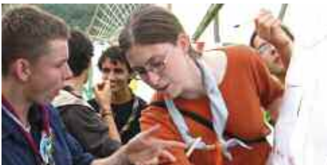
Explication des règles du jeu sur la connaissance des pays européens

occasion de connaître un autre fonctionnement d'organisation scoutée. Chez moi, en République tchèque, nous avons une association scoutée officielle qui rassemble tous les scouts. C'est différent de la France.