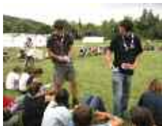
Distribution d'itinéraire et de carnets

Cela fait 2 ans que la Commission Branche Aînée (Cobra) travaille à la rédaction du carnet d'Aîné, Itinéraire. Suite à la relecture du prototype par les aînés lors de Canaan 2006, il a fallu une année à la Cobra pour prendre en compte les remarques et les retours des aînés. Nous avons donc le plaisir de vous annoncer la naissance d'Itinéraire.