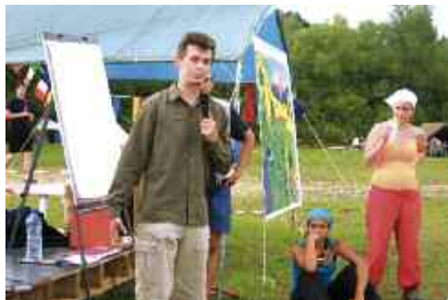
Parler sans tabou du sexe avec le Crips (Centre Régional pour l'Information et la Prévention du Sida).